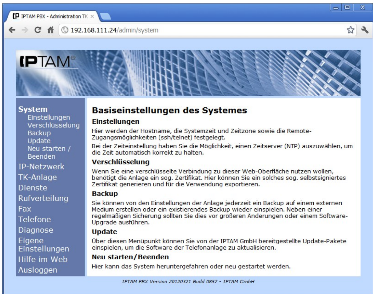
Abbildung 11.1.: Menü System

Unter dem Menüpunkt System finden Sie verschiedene Menüpunkte zur Systemverwaltung der IPATM® PBX.