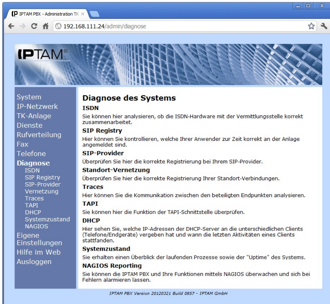
Abbildung 15.1.: Diagnosemöglichkeiten der IPTAM® IP-Telefonanlage