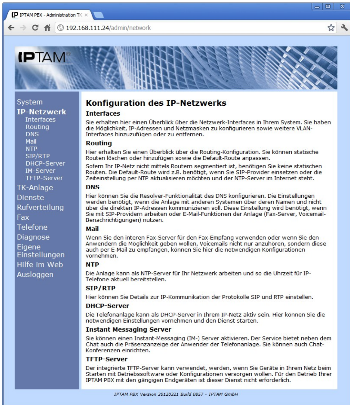
Abbildung 11.2.: Menü IP-Netzwerk